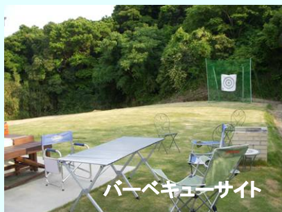
バーベキューサイト