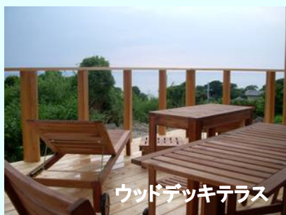
ウッドデッキテラス