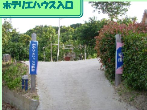
ホテルエハウス入口