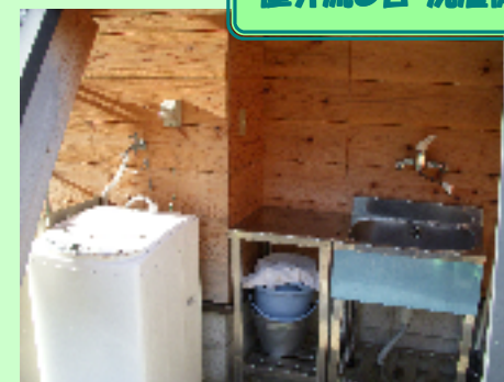
屋外流し台・洗濯機